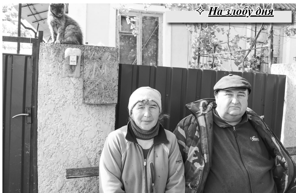
Родина Двойних з Попільного зовсім не в захваті від того, що закрили їхнє поштове відділення та почали курсувати ППЗ. Ні газет не знайдеш, ні платежі не проведеш, бо день приїзду поштової машини не співпадає з їхньою можливістю її застати. В результаті вирішили не передплачувати “Березань” на наступний рік, хоча й люблять її читати.

Натомість в інших – справжній аврал. Люди обривають редакційні й стаціонарні, й мобільні телефони, намагаючись дізнатися, де їхні газети, коли вони отримають пенсії та зможуть оплатити комунальні послуги? Я вже й не пам'ятаю, чи був бодай один день, коли б з трубки лунали обурені нарікання – то зі слізьми в голосі, а то й з “міцним” супроводом. І, що особливо прикро, претензії в переважній більшості звучать на адресу редакції: “Ми ж передплатили Вашу газету,