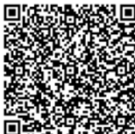
QR код № 2