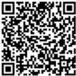
QR код № 1