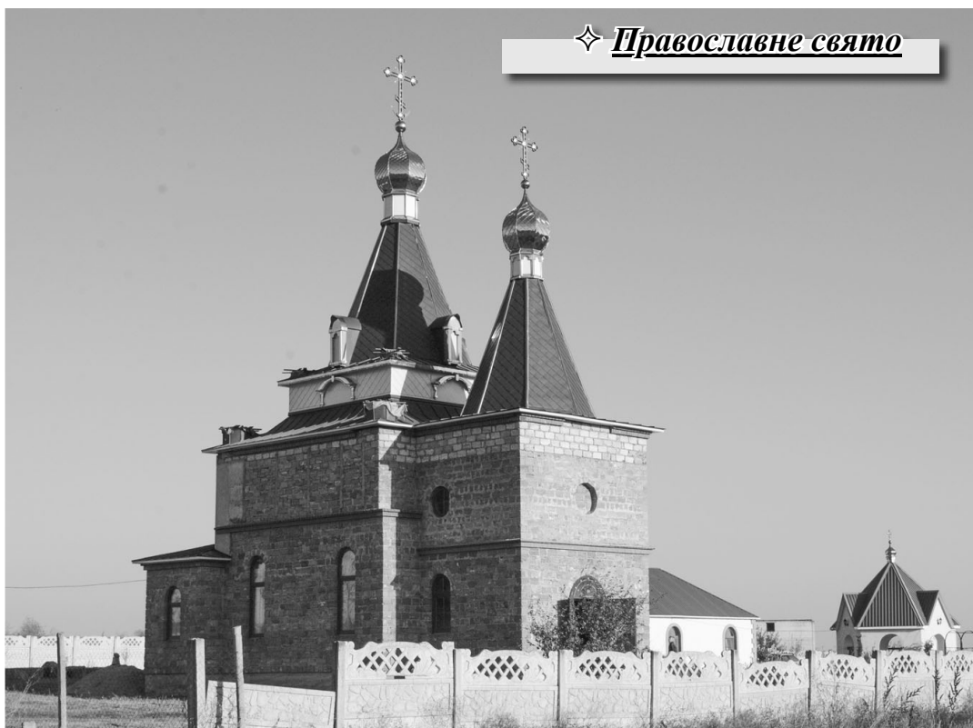
✦ Православне свято