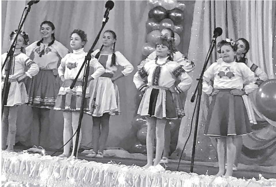
▲ На сцені – сухоеланецькі танцюристи.