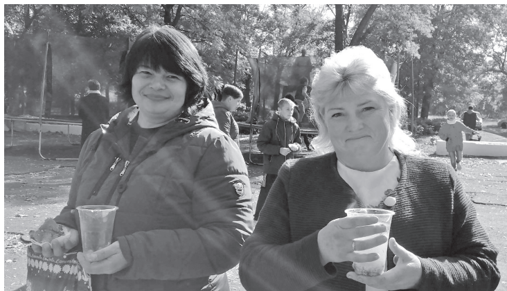
▲ Таку смачну юшку тільки в Бузькому варять!