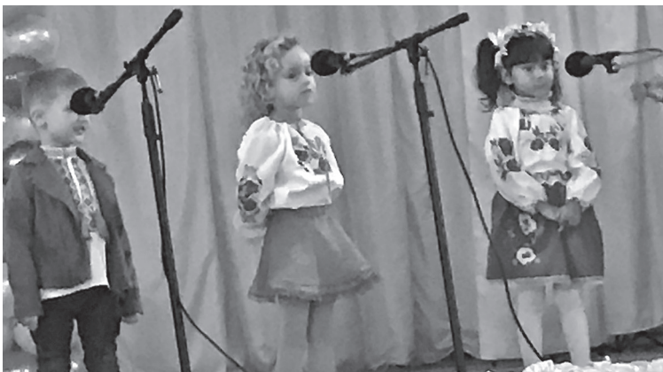
▲ Юні артисти на сцені не тушуються.