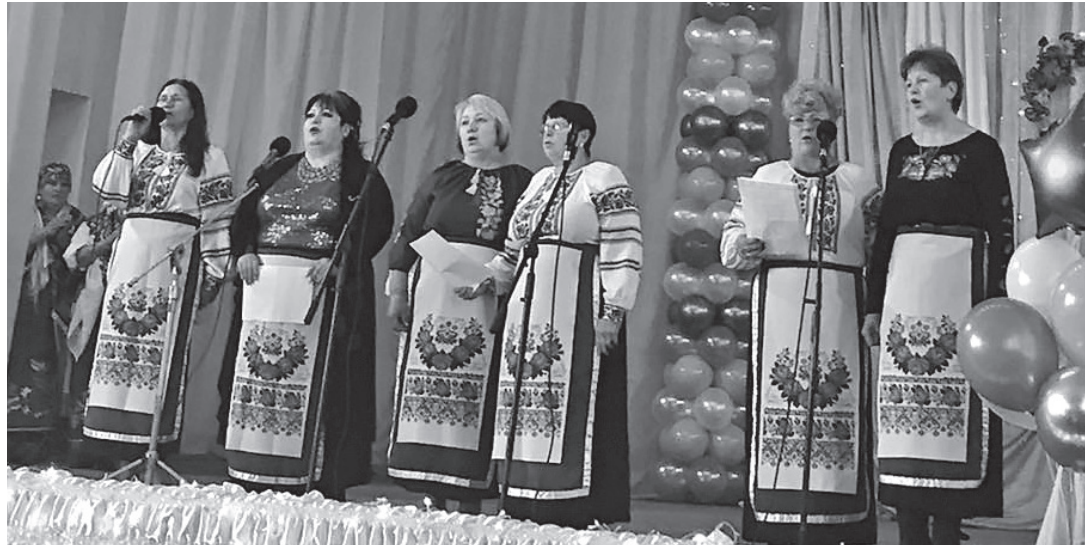
▲ Музичний дарунок від бужчанок.