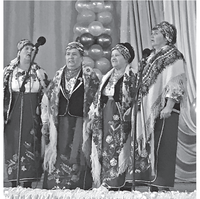
▲ Вінують Бузьке гості з Новошмідтівки.

місцині прегарне велике село у вінках садів, обрамлене родючими нивами? Що народжуватимуться тут покоління за поколінням люди, які житимуть і працюватимуть на цій справді благословенній землі?..