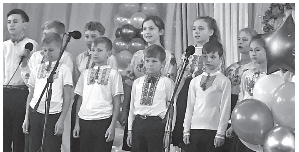
▲ Ох, і співуче покоління в селі підрастає!